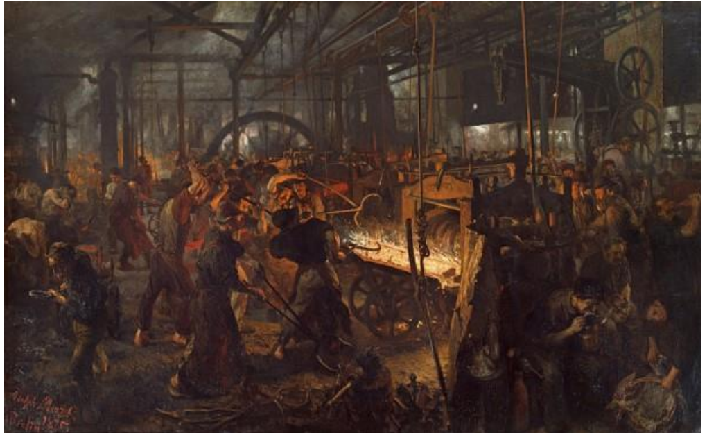
Adolf Menzel, Industriearbeit in einem Walzwerk, um 1875