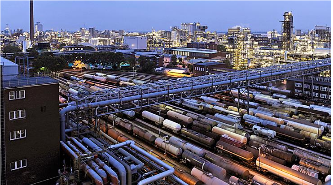
Sachkapital so weit das Auge reicht: der BASF-Konzern in Ludwigshafen

→ Sachkapital unterscheidet sich von der bloßen Anhäufung von Sachwerten (z.B. einer Villa), da es anders als diese mit dem Ziel künftiger Amortisation eingesetzt wird.