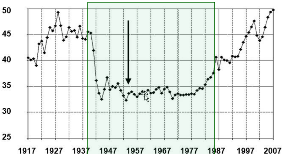
USA: Einkommen des obersten Zehntels in Prozent

Ein bedeutsames Beispiel für Soziale Marktwirtschaft ist der amerikanische New Deal. Noch bis in die 1970er Jahre wurde mit hohen Spitzensteuersätzen (z.T. über 90 %!) das Einkommen des obersten Zehntels der U.S.-Bürger stabil auf ein Drittel beschränkt, was in der Mittel- und Unterschicht zu unglaublicher sozialer Wohlfahrt führte. Die private Profitaneignung – das Hauptmerkmal des Kapitalismus – war also nicht etwa negiert, wohl aber im Ausmaß begrenzt. Noch heute geistert diese Wohlfahrt als Mythos durch die Köpfe, während längst jeder siebente U.S.-Amerikaner von Essenmarken lebt (ab Ende der 1970er Jahre wurde die Reform Schritt für Schritt wieder demontiert).